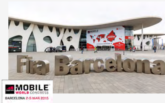
HiQ @MWC Mobile World Congress