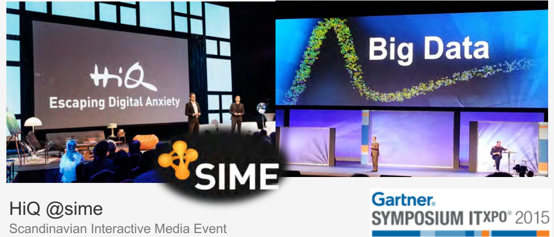
HiQ @sime Scandinavian Interactive Media Event