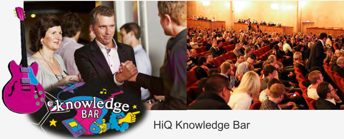
HiQ Knowledge Bar