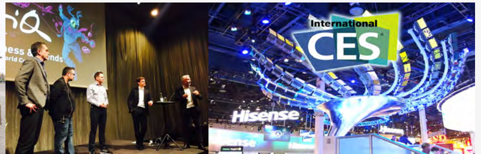
HiQ @CES Consumer Electronics Show